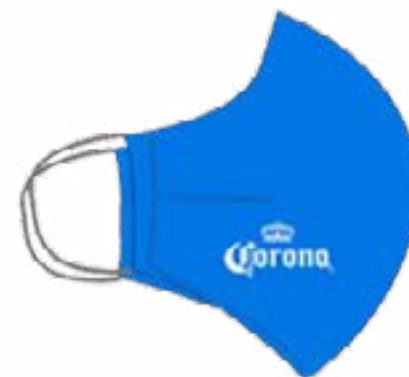
RESORTE AL OIDO