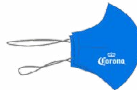
RESORTE A LA NUCA